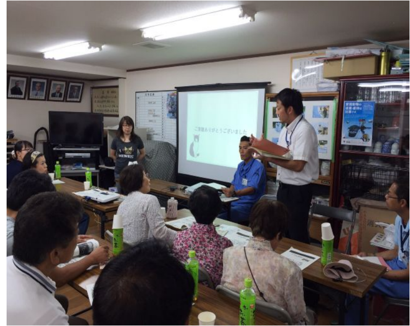
街ねこ制度の説明をする 大阪市健康局の職員(生野区)