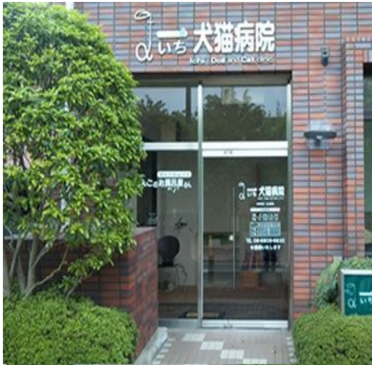
一犬猫病院 (大阪市北区)