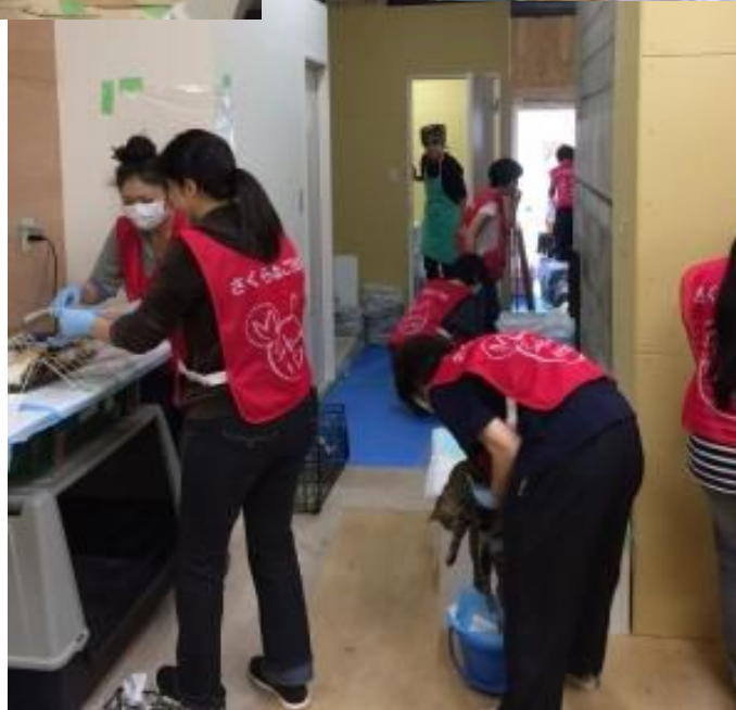
色々な作業をする ボランティア