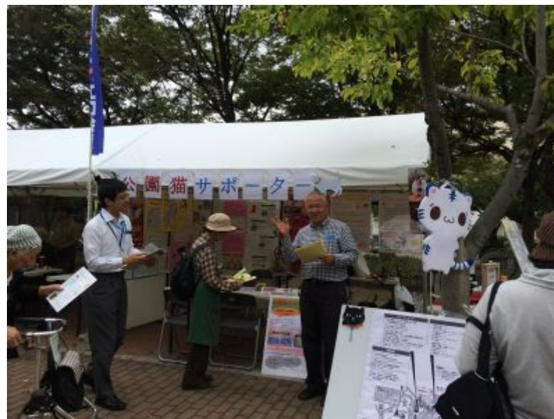
大阪市建設局・健康局の職員