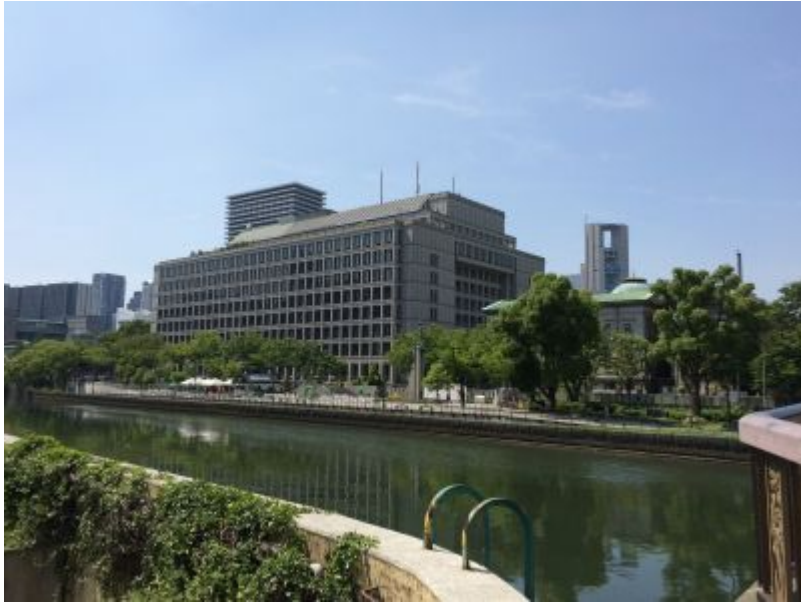
大阪市役所本庁舎