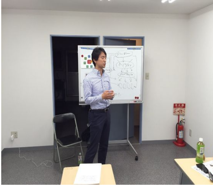
高見大阪市 議会議員と (東住吉区)