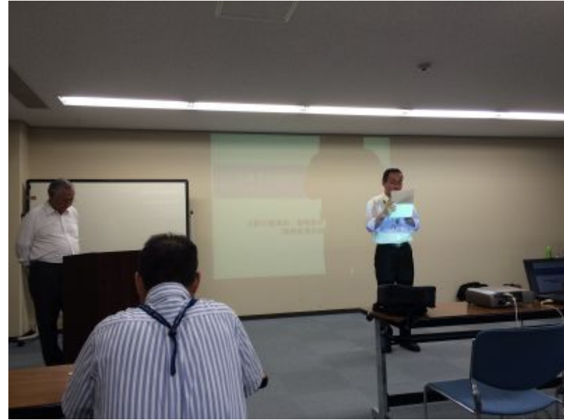
大阪市建設局公園管理課の挨拶