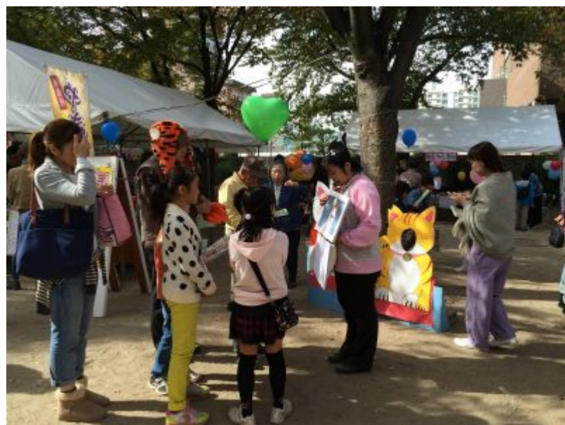
「公園猫」の紙芝居を サポーターが熱演