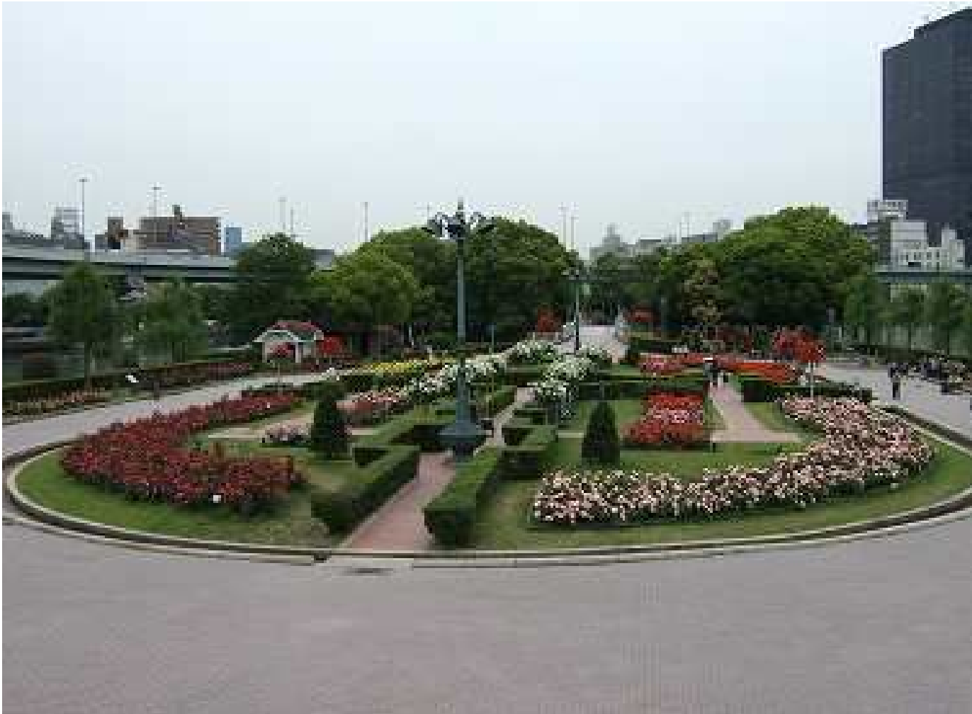
中之島公園のバラ園(大阪市)